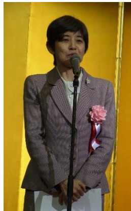
消費者庁 板東長官