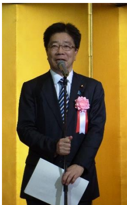
一億総活躍担当大臣 加藤先生