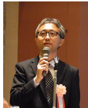
消費者庁 赤崎課長